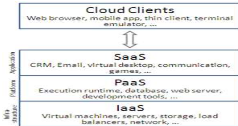
شكل (٢) أنواع الخدمات السحابية