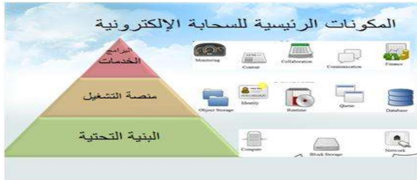
شكل (١) المكونات الرئيسية للسحابة

والشكل التالي يوضح طبقات الحوسبة السحابية الثلاثة